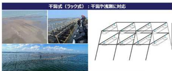
海底に固定した鉄筋ラックにバスケットを固定し、潮汐の干潟を利用し牡蠣を干出させる 漁場の整備が比較的容易で、拡張性や柔軟性が高い

令和6年度 スマートシティモデル事業(県) 干潟式(鉄筋ラック式) 稚貝 3,000個