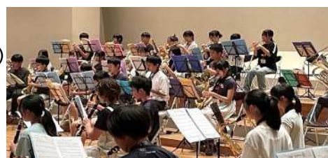
地域クラブ活動の試行(吹奏楽)