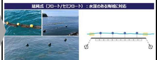
海の水質や潮のあたりが良例で、牡蠣を干出させず常に水中に維持する。 波風の影響を受けにくく、比較的流れやすい海で活用する。

令和7年度 水産業産地化促進事業(市) 延縄式(フロート式) 稚貝 10,000個