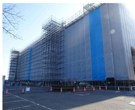
令和8年1月工事状況