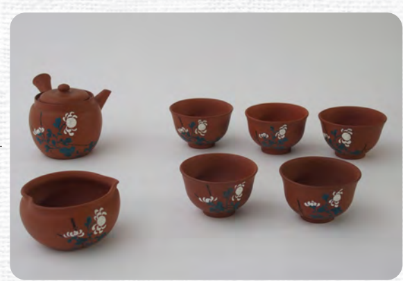
『初代山田常山作 朱泥絵付茶器 一式』

「大正時代の急須」 日時 ～7月7日(日) 料金 無料 場所 資料館 特別展示室