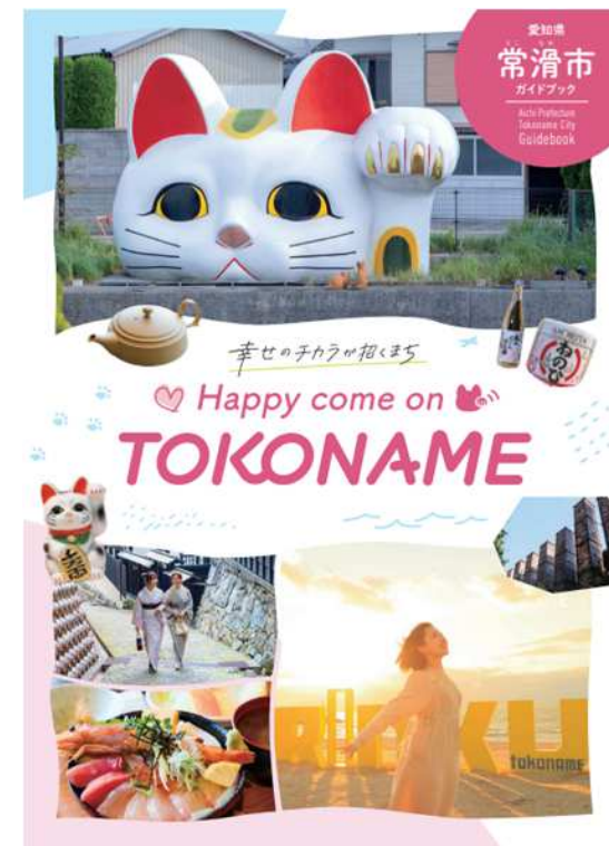
▲旅マエ観光パンフレット