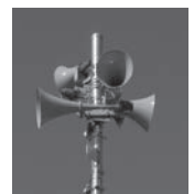
同報無線 スピーカー