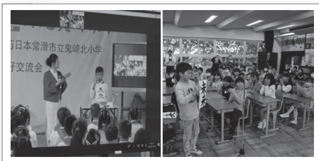
丁山実験小 書道披露