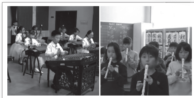
荊溪小 民族楽器合奏