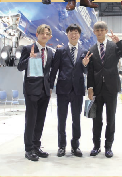
令和6年 実行委員の皆さん

1月7日(日)、中部国際空港の複合商業施設「フ ライト・オブ・ドリームズ」で大和機工(株)協賛、 各航空会社協力のもとに「二十歳のつどい」を開 催し、展示されている旅客機の前で481人の参 加者が式典にのぞみました。 若者が常滑から世界に羽ばたいていくように という願いから、会場を今回から変更しました。 参加者は久しぶりに会った同級生と写真を撮つ たり、思い出話に花を咲かせていました。