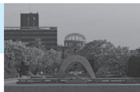
広島市平和記念公園