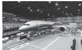
フライト・オブ・ドリームズ