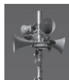
同報無線 スピーカー