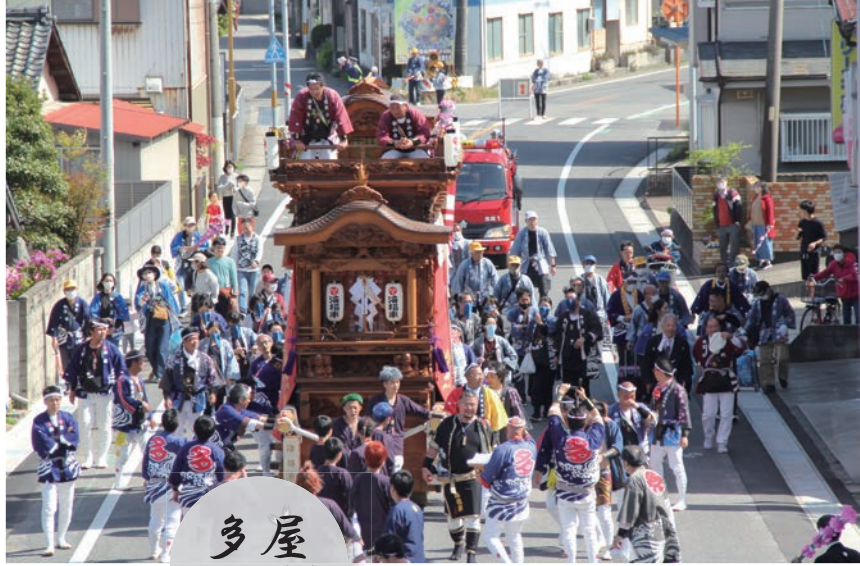
多屋 4月15日(土) 16日(日)