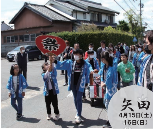
矢田 4月15日(土) 16日(日)