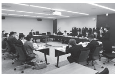
常滑市中学校制服あり方検討委員会

令和3年7月に実施した児童生徒、保護者アンケート結果を踏まえ、令和3年11月に学校や保護者関係者からなる「常滑市中学校制服あり方検討委員会」を設置し、導入決定から、アイテムごとの導入方法など、さまざまな議論をしながら検討を進めてきました。