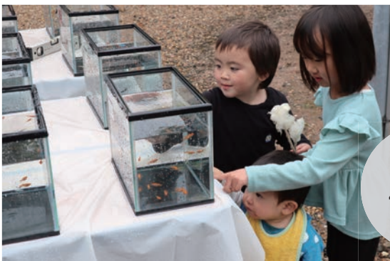
小倉 4月29日(祝) 30日(日)