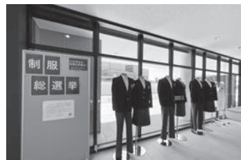
制服総選挙（市役所での一般展示）

取組みの特色としては、導入までのプロセスを大切に、制服総選挙、デザイン募集、アンケートなど児童生徒の意向把握や参画の機会を積極的に確保してきたこと、さまざまなデザインの中に「常滑らしさ」を表現してきたこと、新しい制服の納品遅れが生じないよう、早期に仕様書の公開を行ったことが挙げられます。教育委員会では、今後も学校と連携しながら新入学生の保護者へ早めの注文や採寸周知など、新たな制服がスムーズに導入できるよう進めてまいります。