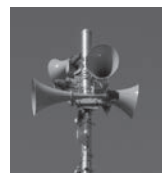
同報無線 スピーカー