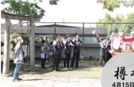
樽水 4月15日(土) 16日(日)