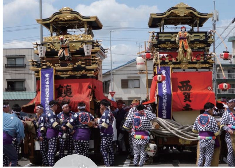
西之口 4月15日(土) 16日(日)