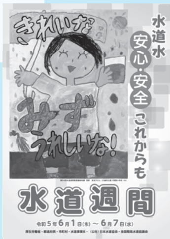
第65回水道週間ポスター