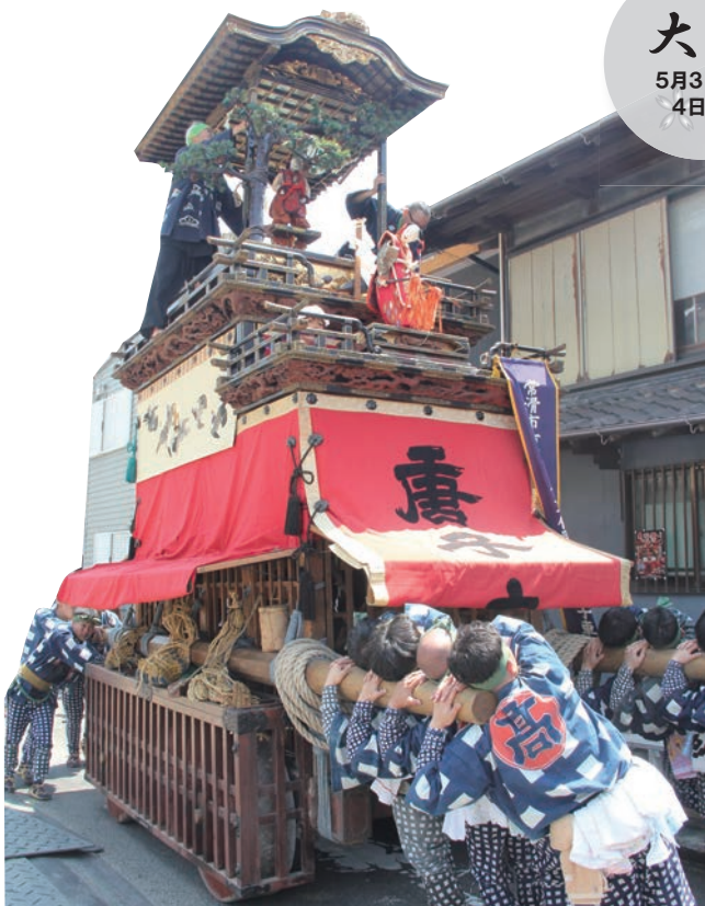
大野 5月3日(祝) 4日(祝)