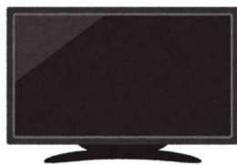
テレビ (液晶・プラズマ・ブラウン管)