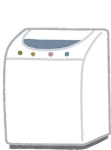
洗濯機 衣類乾燥機

洗濯機、冷蔵庫、テレビ、エアコンの家電4品目は家電リサイクル法により、リサイクルすることが義務付けられています。不用になったら、正しく処理しましょう。