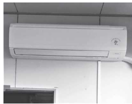
大野南区が更新した大野南集会所のエアコン

令和4年度、助成対象の大野南区は、コミュニティ活動の活性化を図るため、大野南集会所のエアコンを更新しました。