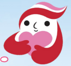
犯罪被害者等支援シンボルマーク 「ギョットちゃん」