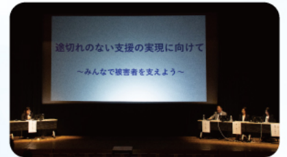
● パネルディスカッション