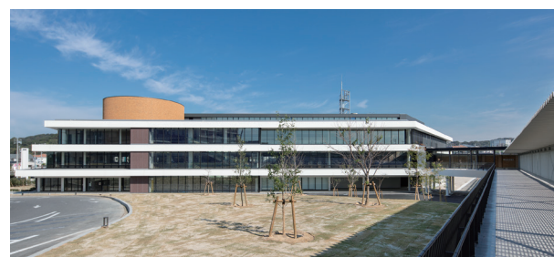
病院玄関から見た連絡通路と市役所正面

知多横断道路常滑ICから車で約3分。 名古屋鉄道常滑駅から 車・タクシー・バスで約10分。 中部国際空港から車で約20分。