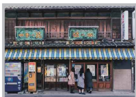
♡ Q いいね! #大野町 #昭和レトロ