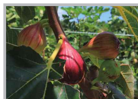
♡ Q いいね! #イチジク狩り #夏から秋が旬