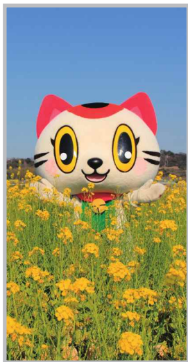
♡ Q いいね! #トコタン #菜の花畑