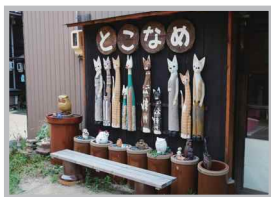
♡ Q いいね! #フォトスポット #猫のまち