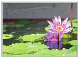
♡ Q いいね! #道端で見つけた花 #ちょっとした景色