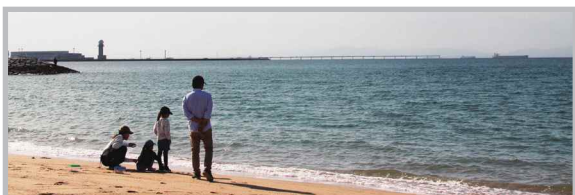
♡ Q いいね! #りんくうビーチ #休日の親子