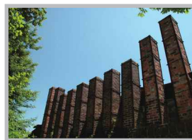
♡ Q いいね! #登窯 #煙突のある風景