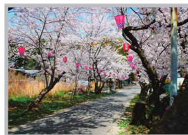
♡ Q いいね! #常石神社 #桜並木