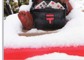
♡ Q いいね! #猫の郵便屋さん #陶彫を探そう