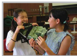
♡ Q いいね! #ノリ #栄養豊富な海