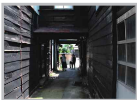
♡ Q いいね! #やきもの散歩道 #歩けば見つかる新発見