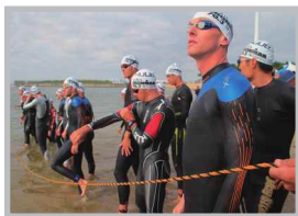
♡ Q いいね! #アイアンマン・アイアンキッズ #大人も子どもも鉄人レース