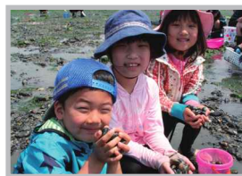
♡ Q いいね! #潮干狩り #いっぱい採れたよ