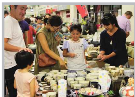
♡ Q いいね! #常滑焼まつり #お気に入りを探せ