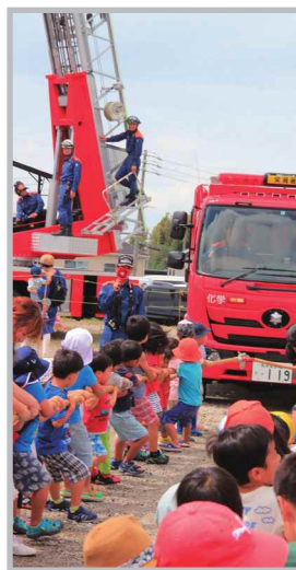
♡ Q いいね! #消防フェスタ #消防車と綱引き