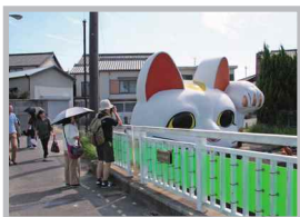
♡ Q いいね! #とこにゃん #トコタンではない