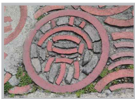
♡ Q いいね! #焼き物散歩道 #見つけてみよう