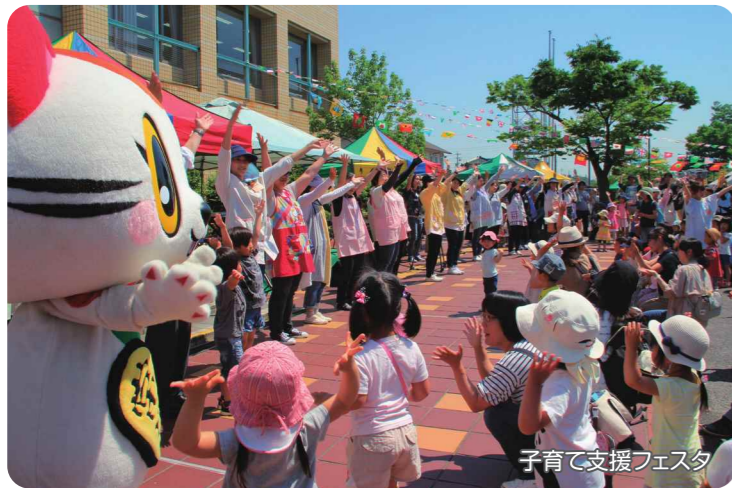
子育て支援フェスタ

次世代を担う子どもたちを安心して育てることができるよう、育児相談や家族同士の交流の場を提供しています。また、保育施設は待機児童「ゼロ」で、保育料も「無償」。小学校では、国際交流も経験できます。