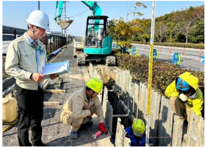
下水道管の据え付け高さ計測の現場立会いの風景

ただ布設するのではなく維持管理を見据えた施工がとても大切で大変なところでもあります。下水道は地元住民の生活の質の向上や周辺環境への改善などの面で公益性が高い事業なので、とてもやりがいを感じます。