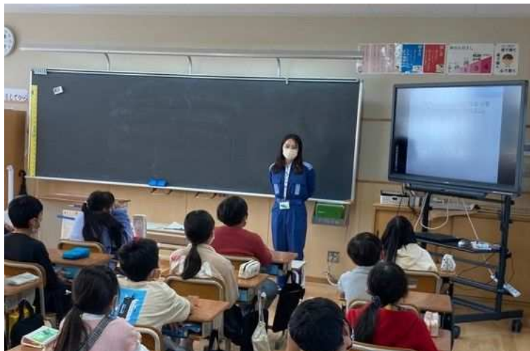
小学校での防災教育の風景

私の担当業務は、補助金業務、防災啓発、備蓄品の管理などです。まだまだ勉強の毎日ですが、さまざまなキャリアをもつ上司のもとで、ご指導いただきながら精進しています。