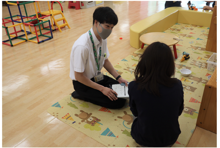
総合計画策定のためのアンケート調査の風景（子育て総合支援センター）

常滑市のふるさと納税が気になったら市のホームページの「ふるさと納税について」をご覧ください。