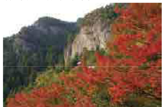
鳳来寺山／天竜奥三河国定公園（新城市）