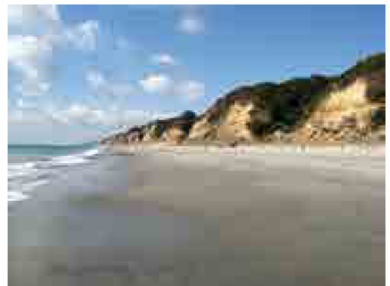
渥美半島海食崖／三河湾国定公園（田原市）

※ 枯損木の伐採、森林保育のための間伐、下刈等通常の管理行為や軽易な行為と認められる行為等は許可を必要としない場合があります。詳細は東三河総局・新城設楽振興事務所・県民事務所（以下、「県民事務所等」という。）の環境保全課や市町村窓口までご確認ください。