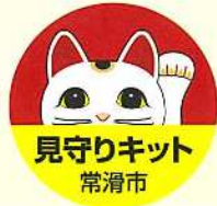
マグネットシール