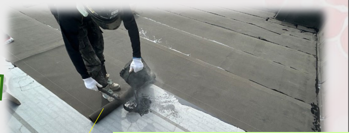
② 防水工事（アスファルト防水）@ 室外機置場

合成繊維不織布のシートに、液状に溶かしたアスファルトを染み込ませコーティングした、ルーフィングシート（建物内に水滴を入れないシート）を二層以上に仕上げることによって、防水機能をより強固にする工法です。