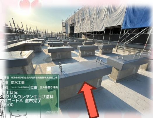
ウレタン塗膜防水