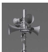
同報無線 スピーカー