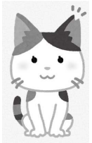
耳先がかットされた猫は地域猫の証

動物は、私たちの生活をさまざまな面で豊かにしてくれる、人間にとってかけがえのない存在です。これを踏まえ、人と動物の共生する社会の実現を図ることを目的として「動物の愛護及び管理に関する法律」が定められています。