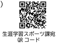
生涯学習スポーツ課宛 QRコード