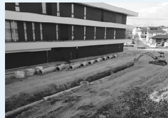
▶外構工事の状況 (7月26日時点)