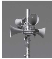
【同報無線スピーカー】