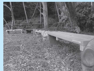
▲城山公園のベンチ

また、市では、募金に協力していただける企業を募集しています。協力いただける場合はご連絡ください。