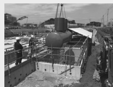
②非常用発電機の燃料を貯蔵するオイルタンクを設置しました。(6月26日時点)