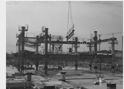
③鉄骨を組み立てています。(8月3日時点)